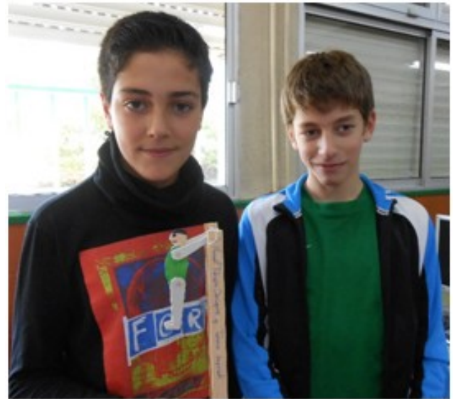
The whole puppets hanged: